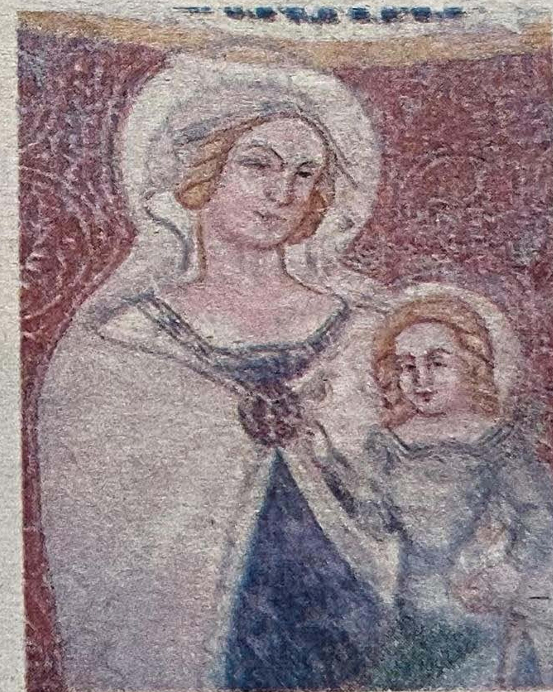
Alcuni dei reperti archeologici di Forcona e, qui sopra, un affresco nella chiesa di San Pietro in Cryptis

Il giorno successivo dalle 15 alle 19 sarà di nuovo la volta del complesso monumentale di Forcona, a Civita di Bagno, mentre dalle 9.30 alle 13.30 e dalle 14.30 alle 18.30, la chiesa di San Rocco